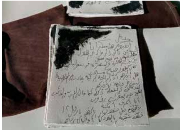
Poet Ashur Etwebi var gjestekunstner hos Artica Svalbard sommeren 2017. Arbeidet «Svalbard blues» ble laget under oppholdet.

Ossietzkyprisen ble overrakt Heier 16. november under eget arrangement på Litteraturhuset i Oslo. Tradisjonen tro ble utdelingen koblet til markeringen av Fengslede Forfatters Dag.