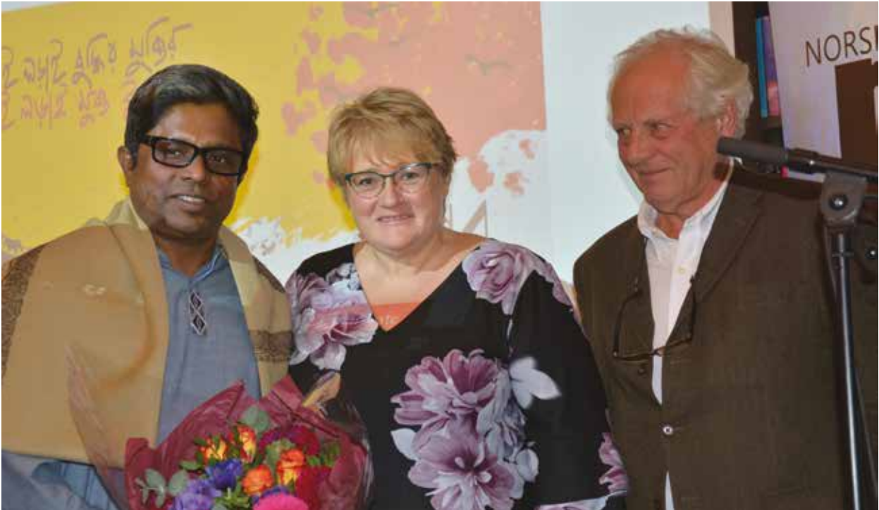
Tutul overrekkes Ossietykypriisen av kulturminister Trine Skei Grande, med William Nygaard.