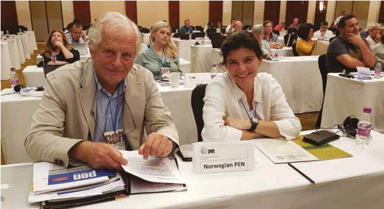
Styreleder og nestleder tar viktige beslutninger under PEN Internationals årskongress i Pune, India.