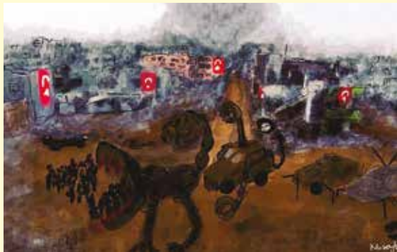
For dette maleriet ble Zehra Dogan dømt til nesten tre års fengsel. Originalbildet er destruert, denne virtuelle versjonen er alt som er igjen.